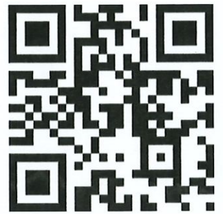
線上報名 QR CODE