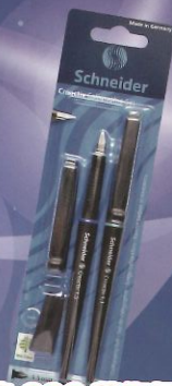
施奈德 693 藝術鋼筆 (含吸墨器)