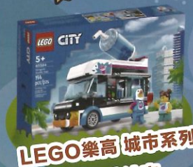
LEGO樂高 城市系列 企鵝冰沙車