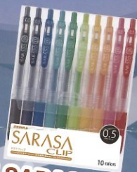
斑馬 SARASA CLIP 0.5 10色組