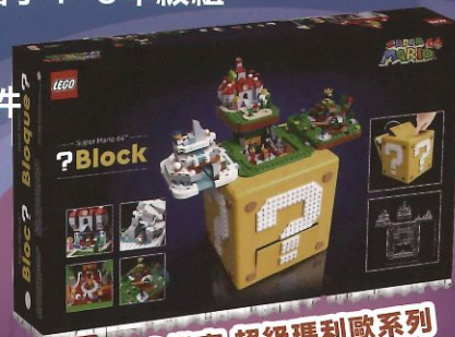
LEGO樂高 超級瑪利歐系列 樂高超級瑪利歐 64 ? 磚塊