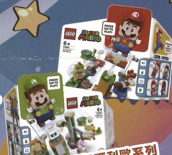
LEGO樂高 超級瑪利歐系列 (路易吉冒險主機/瑪利歐冒險主機) 隨機出貨